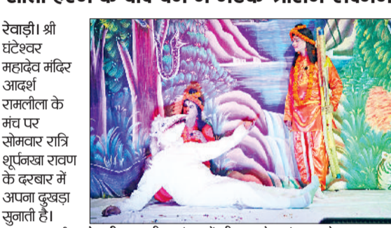
रेवाड़ी। रामलीला मंचन में श्रीराम को वृतांत सुनाते जटायु।

सीता हरण के बाद वन में भटके श्रीराम-लक्ष्मण