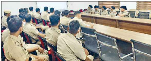
रेवाड़ी। कार्यक्रम में मौजूद लॉ स्टूडेंट्स व पुलिसकर्मी।