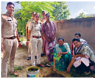
रेवाड़ी। पौधरोपण करते हुए जिला पुलिस टीम।

आने वाली पीढ़ियां स्वच्छ, सुरक्षित और हरित वातावरण में जीवन व्यतीत कर सकें