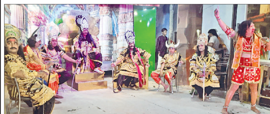
रेवाड़ी। लंका में रावण से संवाद करते हुए हनुमान।