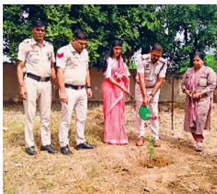
रेवाड़ी। थाने में पौधे लगाते हुए पुलिस टीम।

कसोला, रोहड़ाई व धारूहेड़ा में अपने-अपने थाना परिसर एवं आसपास के एरिये में पौधरोपण कर पर्यावरण संरक्षण और जिले को स्वच्छ और हरा-भरा बनाने का संदेश दिया। जिला पुलिस की ओर से विभिन्न स्थानों पर 700 से ज्यादा पौधे रोपित किए गए। डीएसपी सिटी तथा सभी अधिकारियों व कर्मचारियों ने मिलकर विभिन्न प्रकार के पौधे लगाए।