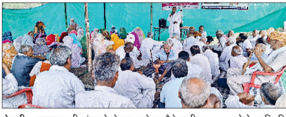
रेवाड़ी। अस्पताल की मांग को लेकर धरने पर बैठे ग्रामीण।